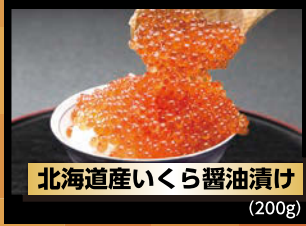
北海道産いくら醤油漬け (200g)