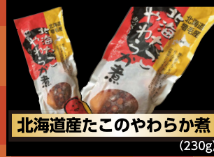
北海道産たこのやわらか煮 (230g)