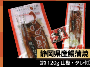
静岡県産鰻蒲焼 (約120g 山椒・タレ付)