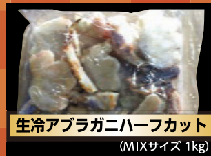
生冷アブラガニ-halfカット (MIXサイズ 1kg)