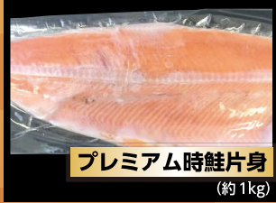
プレミアム時鮭片身 (約1kg)