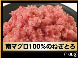
南マグロ100%のねぎとろ (100g)