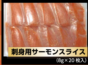
刺身用サーモンスライス (8g×20枚入)