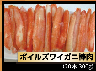
ポイルズワイガニ棒肉 (20本 300g)