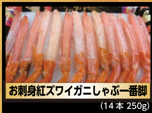
お刺身紅ズワイガニしゃぶ一番脚 (14本 250g)