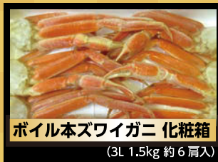
ポイル本ズワイガニ 化粧箱 (3L 1.5kg 約6層入)