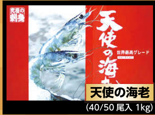
天使の海老 (40/50尾入 1kg)