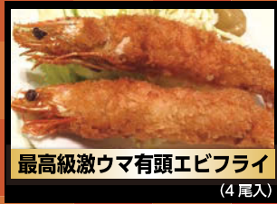
最高級激ウマ有頭エビフライ (4尾入)