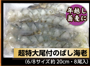
超特大尾付のぼし海老 (6/8サイズ約20cm・8尾入)