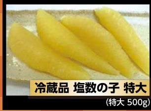
冷蔵品 塩数の子 特大 (特大 500g)