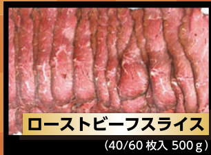
ローストビーフスライス (40/60枚入 500g)