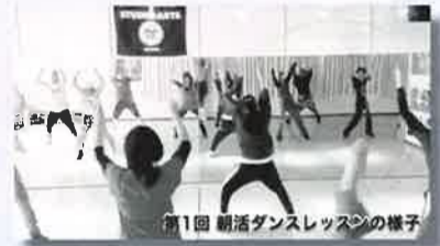
第1回 朝活ダンスレッスンの様子

dance performance company STUDIO ARTS 代表 成岡