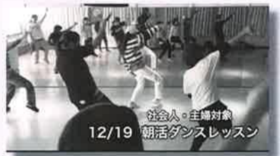
12/19 朝活ダンスレッスン

無理なく程よいリフレッシュとして月1開催ですが大変ご好評いただいております。家事の合間に一汗!ダイエット!何かに夢中